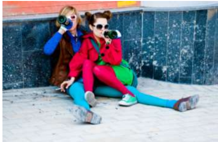
А это «золотая молодежь» того времени...

Мода раскалывается на два лагеря. Люди постарше, устав от погони за джинсой и «фирмой», выбирают спокойные и респектабельные плащи и пальто итальянских фасонов (особо популярны широкие отложные воротники и модель «летучая мышь»),