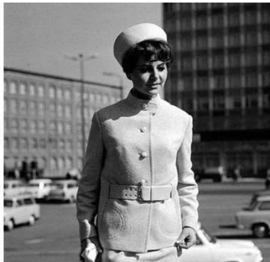
Наряды на каждый день «а-ля Жаклин Кеннеди». Во главе угла утонченность и женственность. 1967 год

Слово «стиляга» перестает быть ругательным, а западные фасоны — порицаемыми. В моду входят миди, шпильки и короткие приталенные пальто.