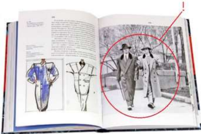
Самые престижные пальто — итальянского кроя