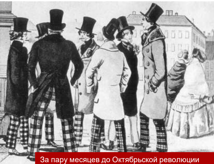
За пару месяцев до Октябрьской революции

Чтобы подчеркнуть свое равноправие, молодые мужчины и женщины ходили в одинаковых солдатских гимнастерках, темно-зеленых «юнгштурмовках» и парусиновых куртках. Культовой одеждой нового строя стала «комиссарская» кожанка в комплекте с фуражкой или завязанной на затылке красной косынкой.