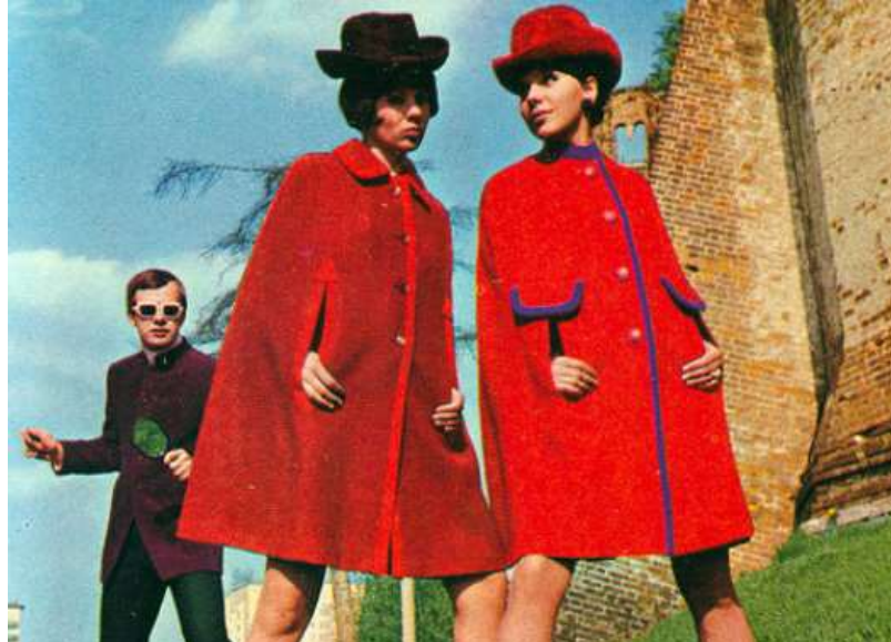
Летние кейпы от молодого советского дизайнера Вячеслава Зайцева. 1965 год.